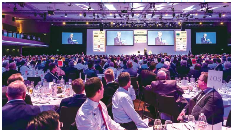
Не PLM-ом единым...

Следующая конференция PLM Connection Europe состоится в том же месте 23–25 октября 2017 года. 👁