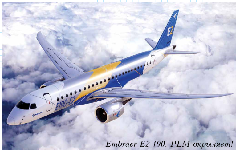
Embraer E2-190. PLM окрыляет!

Одним из драйверов перехода на Teamcenter стало настойчивое стремление руководства SONACA сократить на 20% стоимость разработки изделия в течение ближайших четырех лет, чего с ENOVIA достичь было невозможно. Другой драйвер – намерение сократить ИТ-персонал: с 12-ти человек, отвечающих каждый за свой проект, до двух человек при том же количестве проектов.