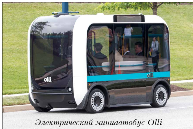
Электрический миниавтобус Olli