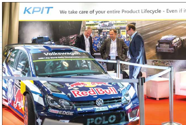
Volkswagen Motorsport: чем круче PLM, тем больше побед!

В завершение презентации руководители SONACA показали захватывающее видео первого полета E2 – в качестве физического подтверждения результативности и правильности их выбора PLM-решения и PLM-поставщика. Вполне